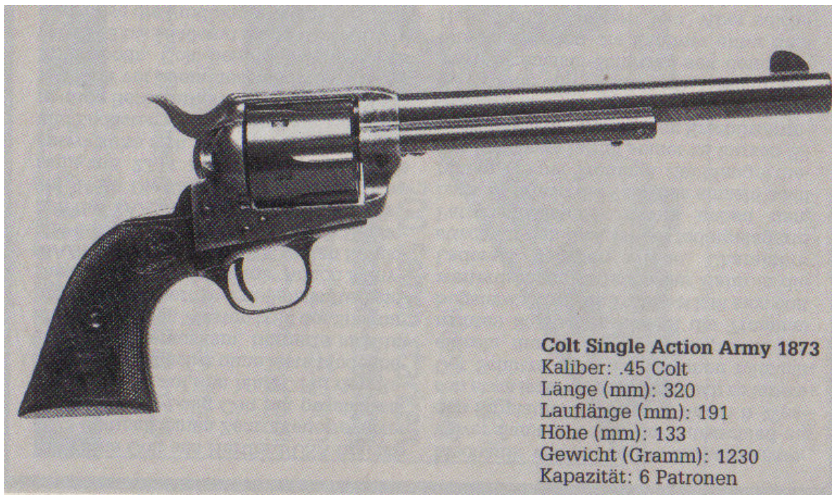
Colt Single Action Army 1873 Kaliber: .45 Colt Länge (mm): 320 Laufänge (mm): 191 Höhe (mm): 133 Gewicht (Gramm): 1230 Kapazität: 6 Patronen

Mängel glich der SAA dadurch aus, dass seine einfache Mechanik sehr robust war und rauere Behandlung vertrug als die komplizierteren zeitgenössischen Revolver.