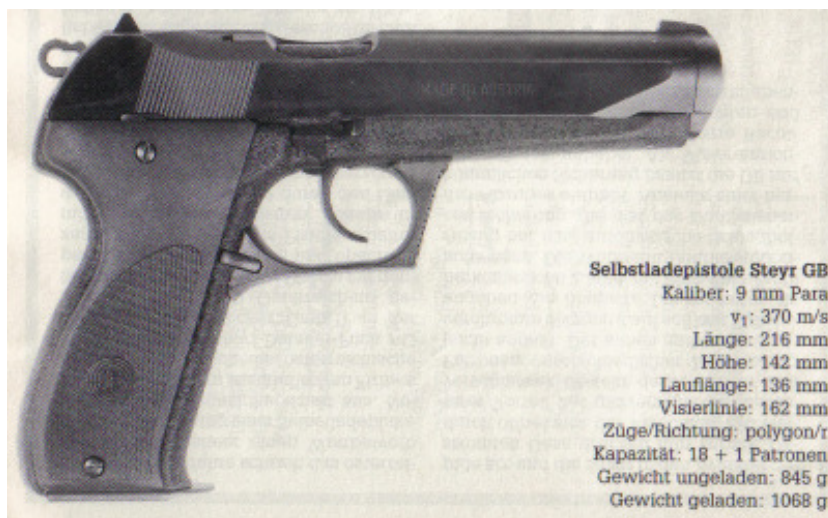
Selbstladepistole Steyr GB Kaliber: 9 mm Para v_1 : 370 m/s Länge: 216 mm Höhe: 142 mm Lauflänge: 136 mm Visierlinie: 162 mm Züge/Richtung: polygon/r Kapazität: 18 + 1 Patronen Gewicht ungeladen: 845 g Gewicht geladen: 1068 g

Neben verschiedenen ausländischen Firmen beteiligte sich auch die österreichische Steyr-Daimler-Puch AG an der Ausschreibung. Steyr stellte sich mit der GB, einer 19-schüssigen Pistole mit doppelreihigem Stahlmagazin und Spannabzug, dem Wettbewerb. Die Pistole hat einen unverriegelten Masseverschluss, dessen Rücklauf durch den Gasdruck der Verbrennungsgase verzögert wird. Rund um den Lauf angebrachte Bohrungen leiten die Gase in einen abgedichteten Zylinder, der den Lauf im vorderen Bereich umschließt. Die Gase im Zylinder wirken entgegen der Rücklaufbewegung der Waffe und dämpfen den Rückstoß erheblich. So lange sich das Geschoss im Lauf befindet, herrscht im Zylinder ein Überdruck, der den Rücklauf des Verschlusses verzögert. Nachdem das Geschoss den Lauf verlassen hat, sinkt der Gasdruck schnell ab und die zuvor in den Zylinder geströmten Gase drücken nun zurück. Dadurch öffnet sich der Verschluss. Ein weiterer Vorteil des gasverzögerten Masseverschlusses ist, dass er sich unterschiedlichsten